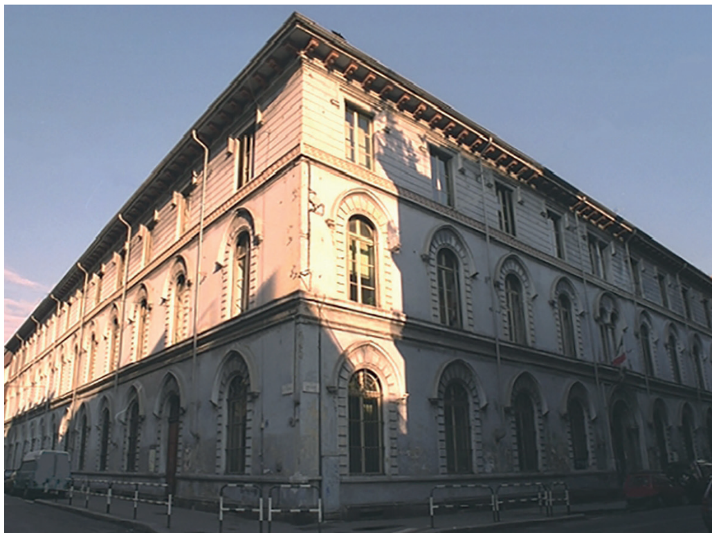
Scuola Primaria "BONCOMPAGNI" Via Vidua 1 - Torino

c.f. 97601890011 - via Le Chiuse 80 - 10144 TORINO tel 011 480330 fax 011 4731731 e-mail: TOIC81700R@istruzione.it pec: TOIC81700R@pec.istruzione.it http://www.icpacinotti.it